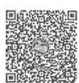
ฉบับที่ ๑๗

สำนักงานปลัดกระทรวง สำนักงานคณะกรรมการมาตรฐานการบริหารงานบุคคลส่วนท้องถิ่น โทร. ๐ ๒๒๒๑ ๘๑๙๗ โทรสาร. ๐ ๒๒๒๒ ๒๑๔๙